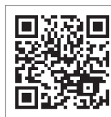
財団ホームページ