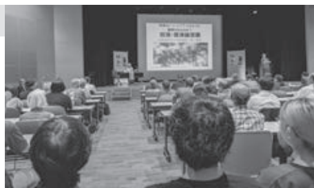
フォーラム開催の様子