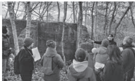
戦跡見学会の様子(格納庫の遺構にて)