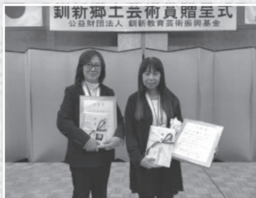
贈呈式でのお二人

2014年に教員として広陵中学校に初赴任し、音楽部顧問を担当。中高生が所属する合唱団「中標津ジュニア合唱団ひかり」の立ち上げにも携わり、全国大会にも出場を果たしてきました。