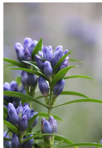
町の花・エゾリンドウ