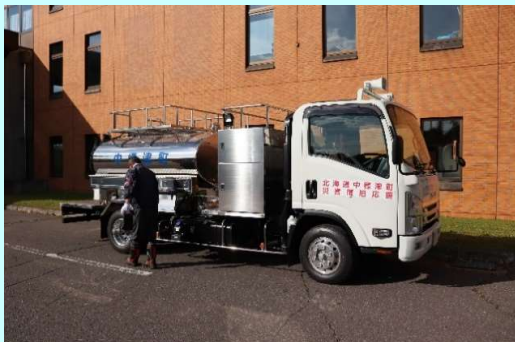
②加圧式給水車(容量3m 3 )