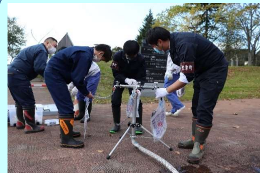
⑥給水栓から給水袋に注水(容量60)