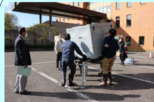
③給水テナ(容量1m 3 )設置状況