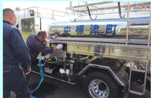
④加圧式給水車により送水