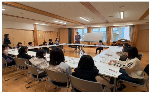
第1回おまつり隊代表者会議の様子